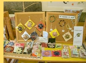
大和市保健福祉センター内 カフェ スパンティーノ