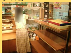
大和市南林間 1-9-17 NPO 法人 たんぽぽ パン工房「麦の香り」