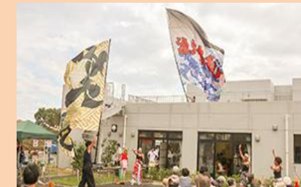
↑伊東の漁船の大漁旗