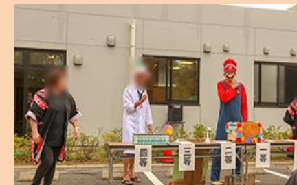
↑スーパーマリオは理事長さん