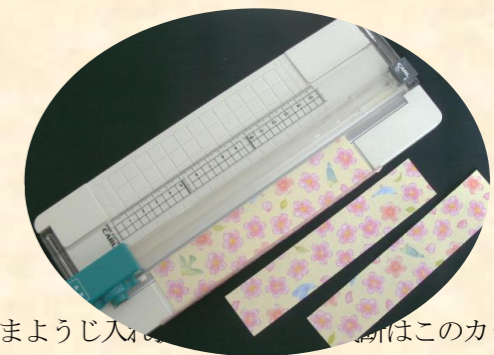
つまようじ入れの作り方はこのカッターを使って行います。

折り紙裁断、布巾の裁断と印付けなど、生活訓練で、まだ作業に慣れないメンバーでも安心して取り組めるように「丁寧に正確に」を心がけて取り組みます。