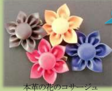
本草の花のコサージュ