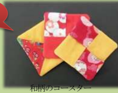
和柄のコースター