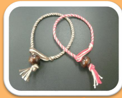
ブレスレット 商品化準備中!

糸の長さを測って切る、束ねて結ぶ、道具にセットする、という工程を経てから編み始めます。最初は戸惑われる様子もありましたが、慣れてくると均等な太さになるよう力加減を一定にし、編み間違えても慌てずにほどいてやり直すなど、作業に慣れてきた方が増えました。近いうちに、商品としてご紹介できればと思います。