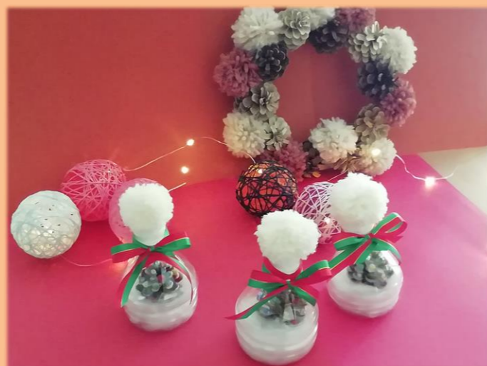
『メンバーの作品とコットンボール』カメラマン Kさん