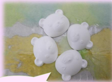
こちらがアロマストーン

石膏を固めて作るアロマストーン制作をはじめました。石膏と水の割合が違うものをいくつか計測しながら制作し、割合の違いが完成にどのような影響が出るのかなどをひとつずつ実験中。固まった状態を観察し、どうすると綺麗な製品になりそうか皆で考察しています。乞うご期待!