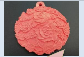
複雑な柄がきれい!