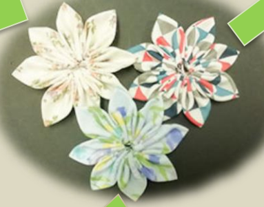
様々な生地で作成しています。

花びらの折り目が左右均等にバランスよくきれいに見えるようにするのが大変でした。完成した時は達成感がありました。(Yさん)