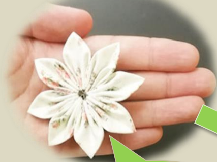
布の花が出来上がります。

布の花づくりは、ほとんどのメンバーが初めて取り組む作業です。最初は苦戦しますが、徐々に針や糸の扱い方に慣れてきて、綺麗なアクセサリが完成していきます。