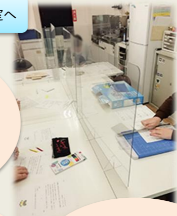
生活訓練室から作業室へ

クロスオーバーnext（就労B）が、クロスオーバー大和の生活訓練室に変わりました。クロスオーバー大和の2つの生活訓練室が、就労継続支援B型の作業室に変わりました。