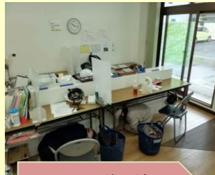
机の下に潜る練習

恒例の防災訓練ですが、今年は雨天の中、就労 B と生活訓練それぞれで行いました。いつ何が起きるか分からない状況に備えて「どこへ」「どのように」行動するのか。利用者の皆さんと一緒に再確認しました。