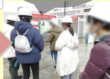
やまと公園の防災機能の説明