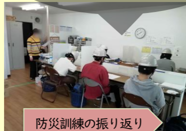
防災訓練の振り返り